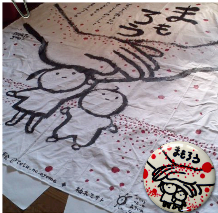
かきおろし、巨大ハンカチ！

おなじみのあかつぶ缶バッジも経産省前に。声にはしにくい「被曝、気にしています」の目印に、と作られて6200個皆様のお手元に届きました。通常WBC購入の為の100円の寄付含む200円での販売ですが、今回の売り上げは全額テント村行動に寄付されます。