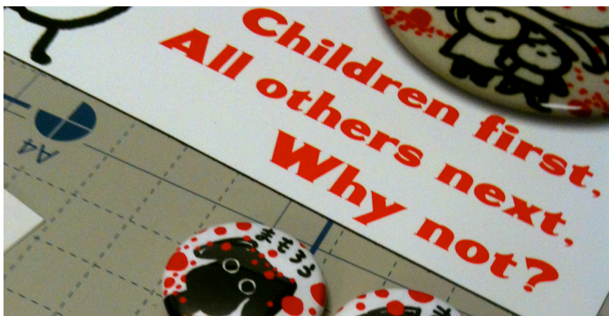
あかいつぶつづの絵、被曝を気にする人の目印に。

ホットスポット流山市在住。あかつぶ缶バッジ作戦委員。日々しあわせをたくらみ手を動かす、3オムスメの母。あかつぶの絵を缶バッジにして声に出しにくい「被曝のことを気にしているの」の目印に！と思い立つ。1個100円の寄付付き200円で配布。（6ヶ月で6000個）寄付は主にWBCを購入する為の寄付を募る団体に寄付します。子ども守りますけど、なにか？ http://blog.livedoor.jp/akatubukan/