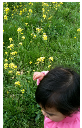
事故前、菜の花の土手で。